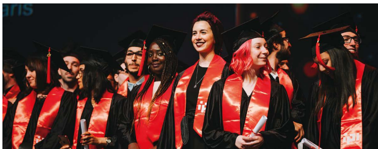
CÉRÉMONIE DE REMISE DES DIPLÔMES