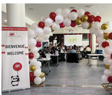
SOIRÉE DES ADMIS